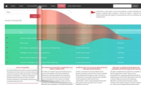
AIS dhe ACER shprehin shqetësim për situatën në institucionin më të