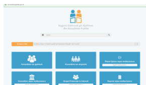
Draft Ligji për PPP Koncesione, AIS (NGO) shpreh shqetësime mbi standardin për